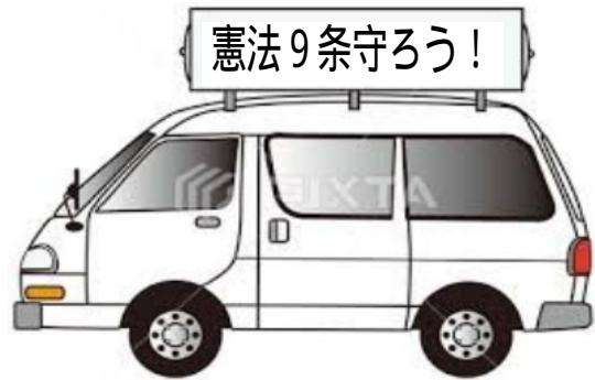
町田南地域九条の会は月2回宣伝カー宣伝をしています