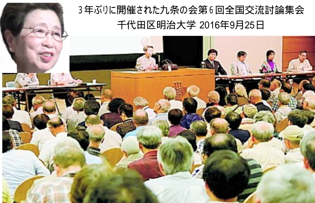
3年ぶりに開催された九条の会第6回全国交流討論集會 千代田区明治大学 2016年9月25日

立ち上げる」と述べました。は、世話人代表を含め3名 町田南地域九条の会から が集会に出席しました。