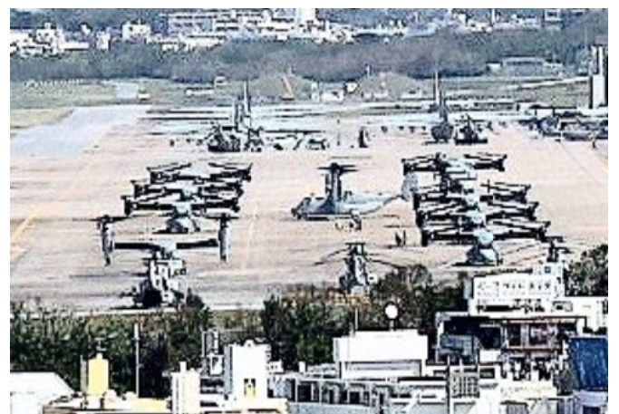
写真上: 北朝鮮ミサイル発射 2017.3.6